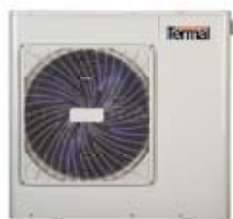
TCWNMS 501 X TCWNMS 701 X