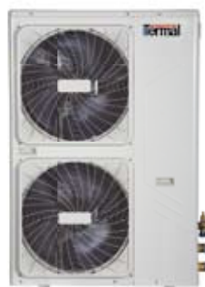
TCWNMS 1001 X TCWNMS 1201 X