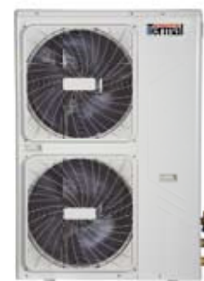
TCWSMS 1201 X TCWSMS 1401 X TCWSMS 1601 X