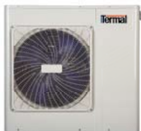
Monofase 5~7 kW TCWNMS 501 X TCWNMS 701 X