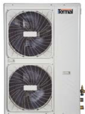
Monofase 10~12 kW TCWNMS 1001 X TCWNMS 1201 X